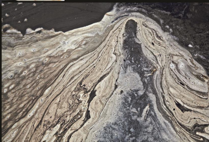
Jaap van Dijk